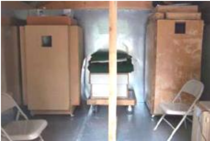
Dwa akumulatory orgonowe w wyłożonym metalem pomieszczeniu w Orgone Biophysical Research Lab