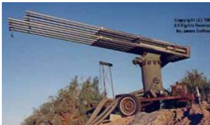
Działo orgonowe (tzw. cloudbuster) używane w czasie eksperymentów w Arizonie (1978-79). Urządzeni

Kolejne zaproszenia napływały z Namibii i Erytrei, gdzie podobne programy manipulowania pogodą przy pomocy orgonu przeprowadzano za prywatne pieniądze przy logistycznym wsparciu państwa. 12-letni okres susz w Namibii udało się odwrócić dzięki wykorzystaniu dział orgonowych. Dalsze przedsięwzięcia w celu rekultywacji całych obszarów zostały stoperdowane przez protesty meteorologów i ich interwencję u władz. Pojawił się też dość wyraźny i często powtarzający się wzorzec. Przeciwko podobnym zabiegom występowały ośrodki świadczące usługi prognozowania pogody jak i firmy praktykujące tzw. „sianie chmur”, które nie były sobie same w stanie poradzić ze skutkami susz.